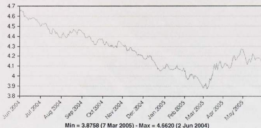
Wykres 2. Kurs wymiany EUR/PLN w okresie od czerwca 2004 r. do maja 2005 r.

Graph 2. EUR/PLN exchange reference rates during the period June 2004 – May 2005