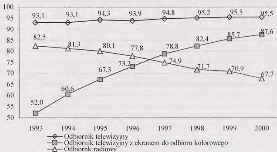
Rys. 2. Wyposażenie jednoosobowych gospodarstw domowych ogółem w wybrane przedmioty trwałego użytku służące rozrywce i pozyskiwaniu informacji w latach 1993–2000 (w %)

Analizując wyposażenie jednoosobowych gospodarstw domowych w przedmioty trwałego użytku służące rozrywce oraz pozyskiwaniu informacji, można zauważyć wysokie nasycenie gospodarstw domowych odbiornikami telewizyjnymi (95,5% jednoosobowych gospodarstw domowych), przy czym wyraźnie zaznacza się dynamiczny wzrost liczby odbiorników z ekranami do odbioru kolorowego i spadek liczby odbiorników z ekranem do odbioru telewizji czarno-białej. Na przestrzeni analizowanego okresu odsetek jednoosobowych gospodarstw domowych wyposażonych w telewizory z ekranem do odbioru telewizji kolorowej wzrósł z 52% w 1993 r. do 87,6% w 2000 r. (wzrost o 35,5%). Być może rosnąca liczba odbiorników telewizyjnych w gospodarstwach domowych jest przyczyną spadku liczby odbiorników radiowych, bowiem jak wykazują dane w analizowanym okresie liczba odbiorników radiowych zmniejszyła się o prawie 15% (z 82,5% w 1993 r. do 67,7% w 2000 r.) (rys. 2).